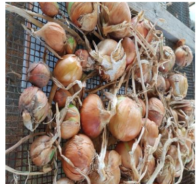
Uitjes : formaat plantuitje

Aardbeien, hier en daar een vruchtje, wel zijn ze lekker zoet