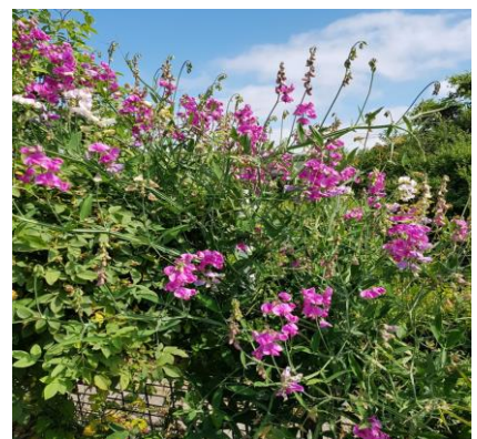
Een gezoem van hommels en bijen bij de Lathyrus

Een les voor mij: hoe de omstandigheden ook zijn, er is altijd wel iets waar je blij van wordt. Dus welke narigheid zich ook voordoet, gewoon doorgaan met zaaien en planten en af en toe gewoon genieten van al het moois. En hoe weinig ook, er is altijd wel wat te oogsten.