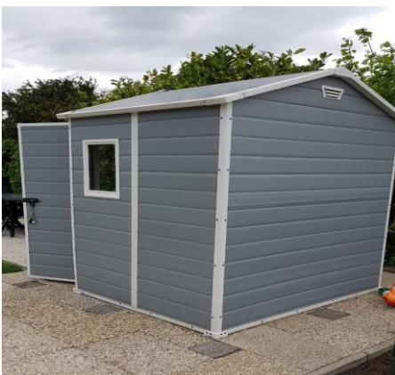
Handig schuurtje om de aangeschafte spullen in op te bergen

Van onze buurman op de tuin kregen we aardbeiplantjes. Dat waren de eerste plantjes in onze tuin. We proberen het gewoon en zien wel hoe het zal gaan."